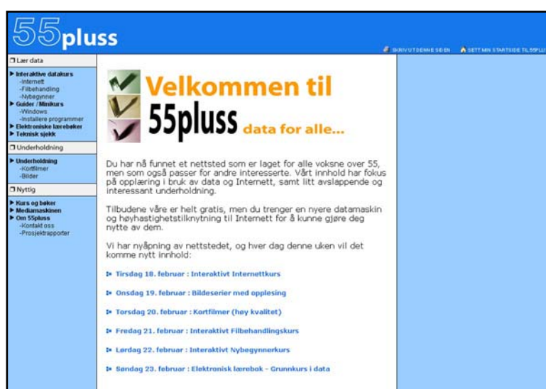
Fig: Velkomsside på www.55pluss.no

Det skal utvikles en underholdningsseksjon med film, musikk og billedserier på nettstedet. Med et enkelt grensesnitt skal man kunne spille av interessant underholdning, gjerne som avveksling mellom interaktive datakurs. Tjenesten skal også demonstrere de spennende underholdningsmulighetene som ligger i Internett.