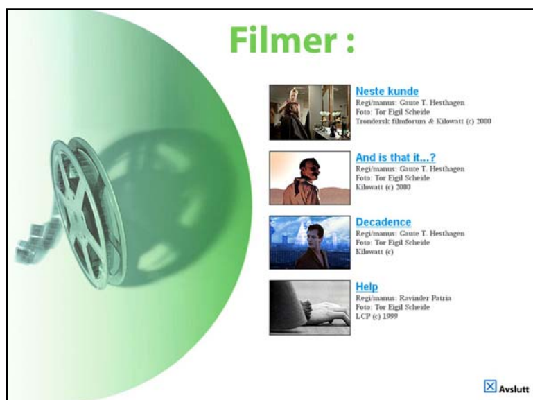
Fig: Utdrag av underholdningsseksjonen m/kortfilmer

Innholdet på nettstedet blir nå demonstrert og veiledet ved tre møteplasser i Trondheim (Aktivitetsbasen Gulhuset, Eldres hus og Kultursenteret for eldre i Strinda). Her er det stadig økende datainteresse, som vil øke ytterligere med dette tilbudet. Vi etterlyser også nye samarbeidspartnere, som med vår veiledning vil ta i bruk våre kurstilbud. Som hjelp til dette skal det utvikles en veiledningspakke, med brosjyre, kompendium og andre nødvendige vedlegg.